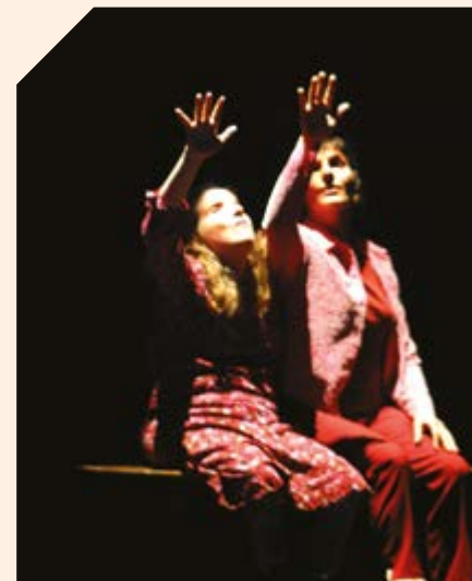
Ouvrez la porte, échappé(e)s...