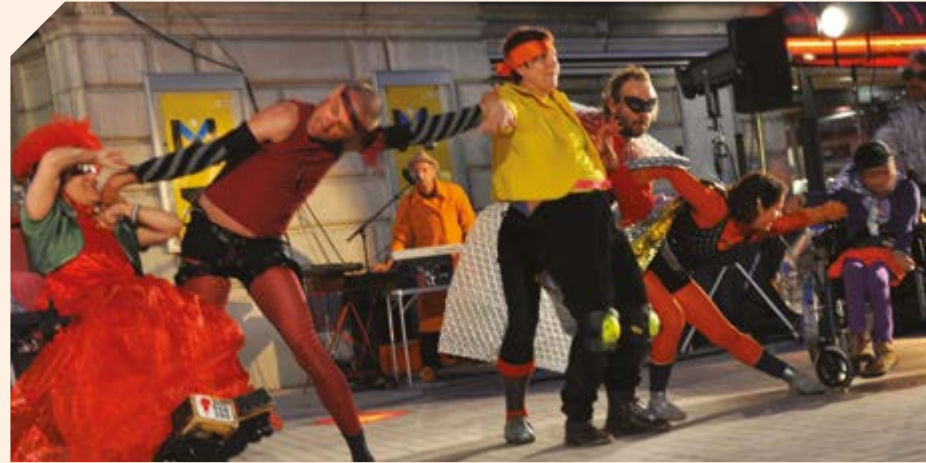
Création Super Héros © Yvette Louis 2014