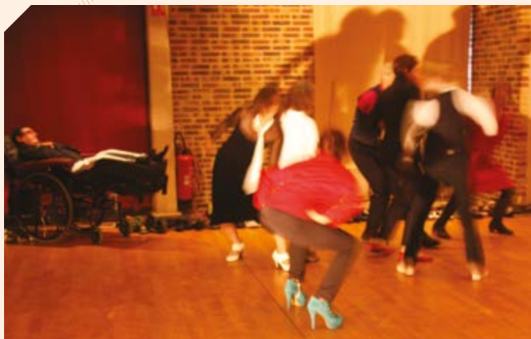
Création Bien dans ses pompes © Florie Bel 2013

Au spectacle Bien dans ses pompes, on était avec des handicapés et il fallait s'exprimer.