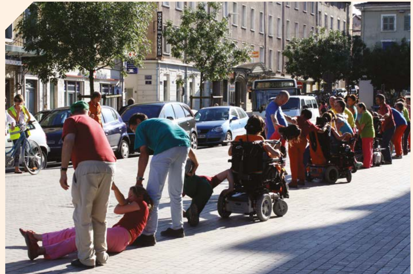
Danseurs Compagnie Passaros, création Corps Paysage(s)