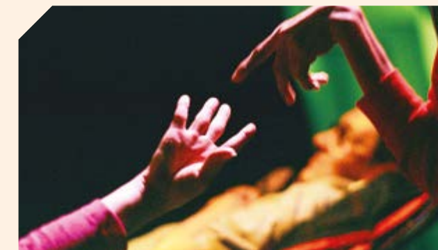
Ouvrez la porte, échappé(e)s...