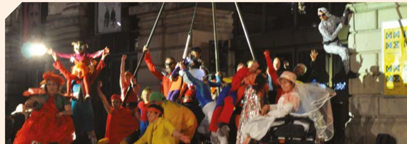
Création Super Héros © Yvette Louis 2014

Ce soir en rentrant de Treffort je me sens déroutée par l'entretien que je viens de réaliser avec Nicolas et son passage sur le cirque. J'allume la radio dans la voiture, France Culture. L'émission parle du retour du pâté-croute et de ses valeurs gustatives en fonction des ingrédients utilisés dans sa composition. J'éclate de rire. Nicolas n'est pas plus sur-réaliste (ou réaliste) que notre monde ! Encore une fois, je comprends que tout est question de perspectives. Il aurait sa place dans une émission de France Culture. La richesse de nos perceptions, sensations, imaginaires nourrit le mouvement et les danses. Il s'agit juste de faire confiance à chacun et de laisser l'espace aux surgissements.