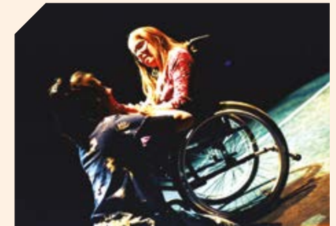
Création Ouvrez la porte, échappé(e)s... © Yvette Louis et Daniel Gillet, 2004.