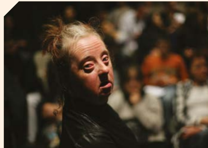
Équipe de la création Silence ! © Muriel Guigou et Daniel Gillet 2010