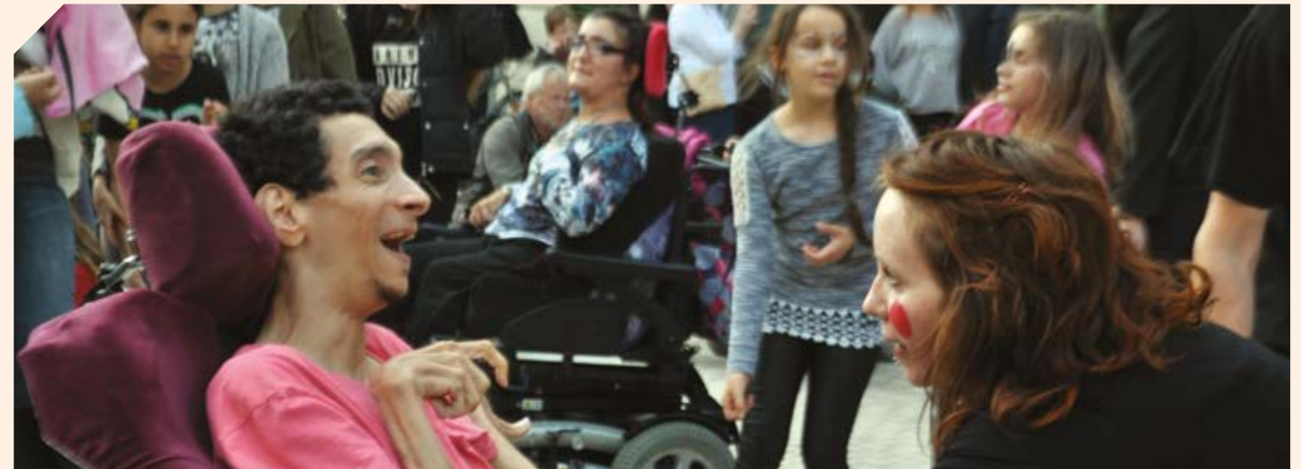
Création Le Tri'Bal © Yvette Louis 2015

Le Tri'Bal a joué pour L'irRégulier#3 à Bourg-en-Bresse, pour Musicollines à Treffort, pour Bas les masques , événement culturel et artistique de la ville de Bourg-en-Bresse, pour le Voyage dans les arts à Cuisiat.